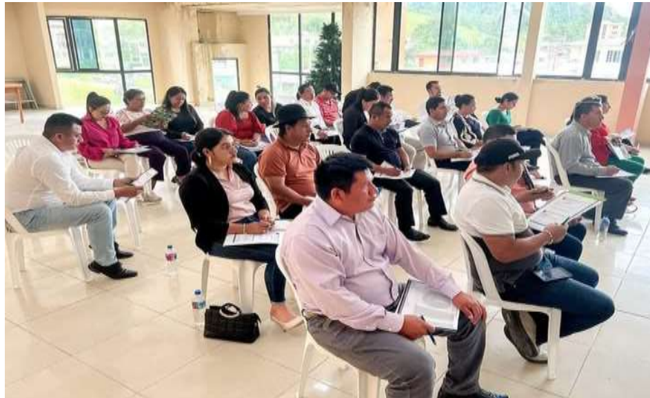
CAPACITACIÓN Nro.- 2.- Capacitación de Asesoramiento a postural proyectos sociales con el MIES”, la misma que se efectuó en las instalaciones de MIES Zamora con la participation de técnicos y la Directora Distrital.