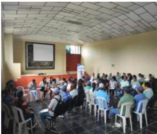
CENTINELA DEL CÓNDOR